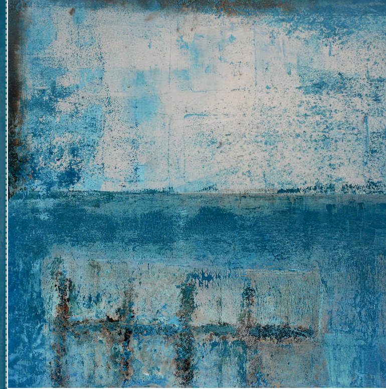
Markus Lindinger - octo s