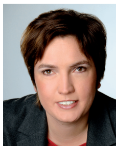
Irmgard Badura Beauftragte der Bayerischen Staatsregierung für die Belange von Menschen mit Behinderung