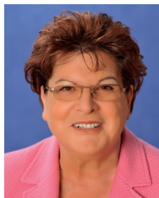
Barbara Stamm Präsidentin des Bayerischen Landtags

Wir freuen uns deshalb sehr, in diesem Jahr zum fünften Mal private Betriebe und öffentliche Dienststellen auszeichnen zu können, die sich bei der Beschäftigung von Menschen mit Behinderung besonders hervorgetan haben. Im Rahmen einer Feierstunde wird dieses besondere Engagement angemessen gewürdigt werden.