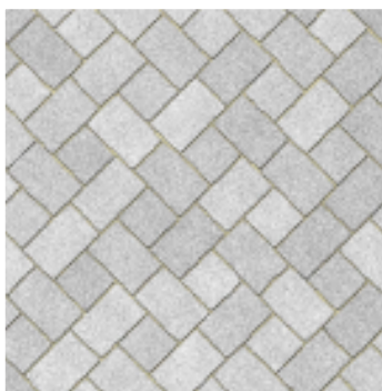
Verlegemuster des Pflasters

Die noch bestehende über die Fahrbahn gespannte Beleuchtung soll durch Straßenlaternen (wie in der Maximilianstraße) ersetzt werden.