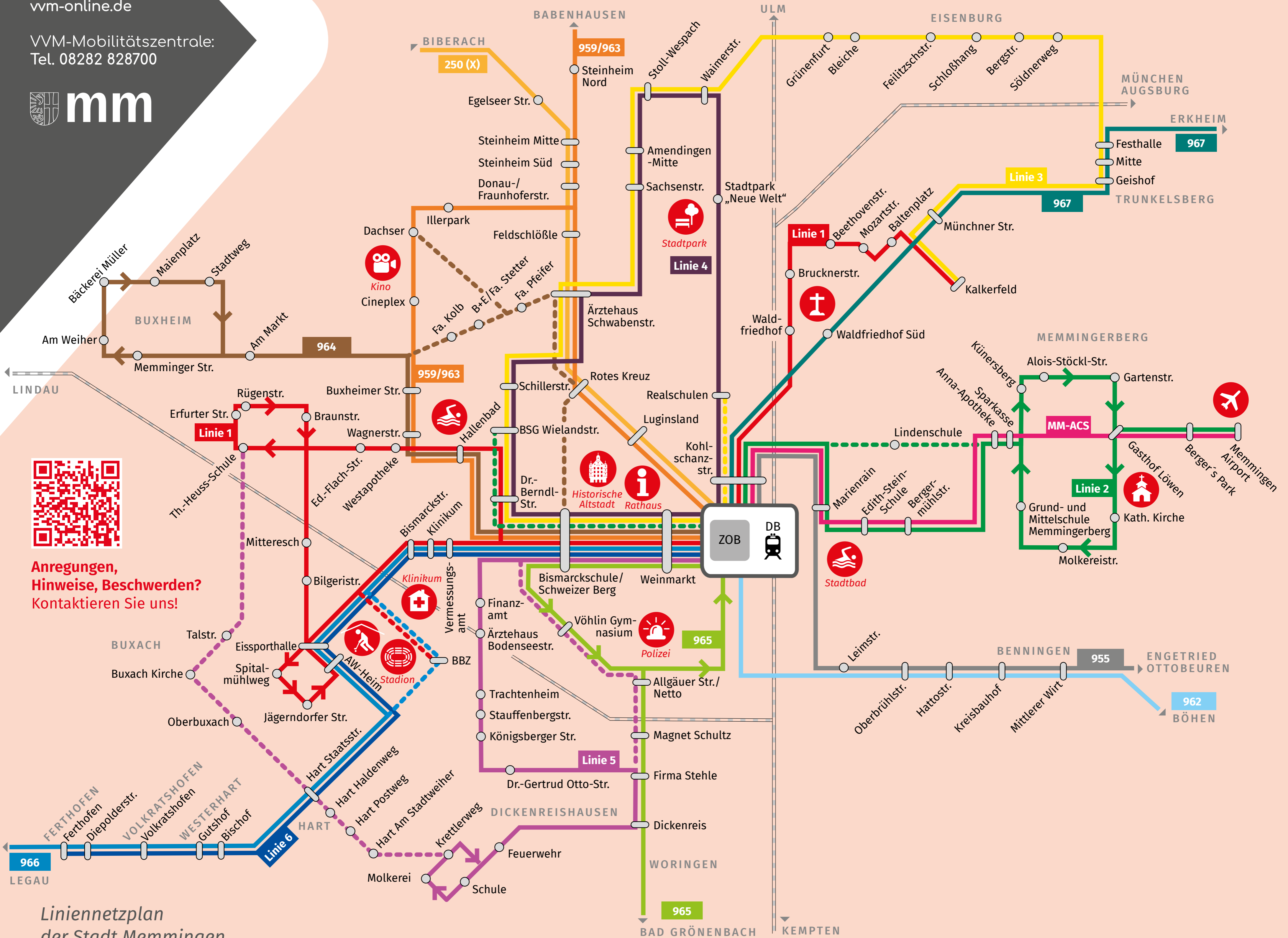
Liniennetzplan der Stadt Memmingen